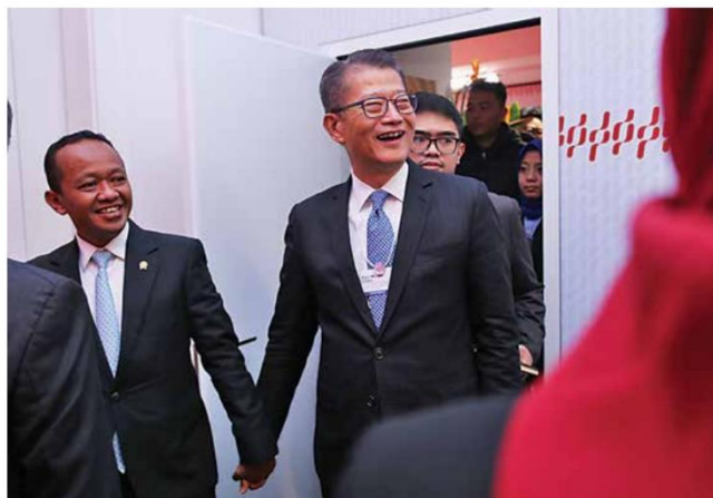
Menteri Investasi/Kepala Badan Koordinasi Penanaman Modal (BKPM) Bahlil Lahadalia (kiri) bergandengan tangan dengan Menteri Keuangan Hong Kong Paul Chan Mo-po di sela-sela pertemuan

di Indonesia Pavilion yang diselenggarakan bersamaan dengan World Economic Forum (WEF) Annual Meeting di Davos, Swiss, Kamis (19/1).