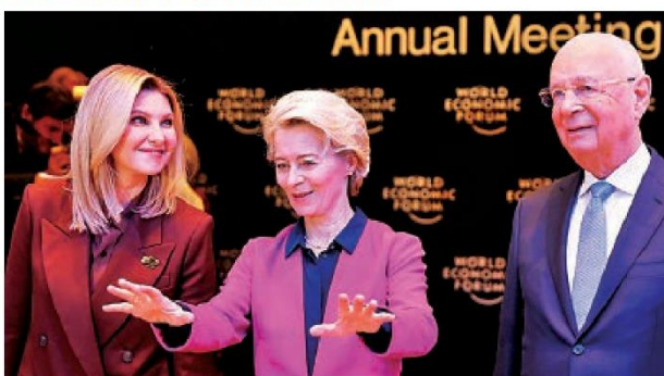
Presiden Uni Eropa Ursula von der Leyen (tengah) bersama Executive Chairman of the World Economic Forum (WEF) Klaus Schwab (kanan) dan Ibu Negara Ukraina Olena Zelenska, menghadiri pembukaan WEF

di Davos, Swiss, Selasa (17/1). Forum ekonomi yang berlangsung hingga 20 Januari 2023 tersebut mempertemukan para pemimpin dari pemerintahan, bisnis, dan masyarakat sipil untuk membahas keadaan dunia.